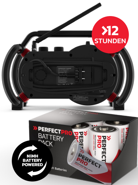
NiMH 6XC AKKUPACK

Spielt den ganzen Tag mit den optionalen universellen NiMH- Akkus