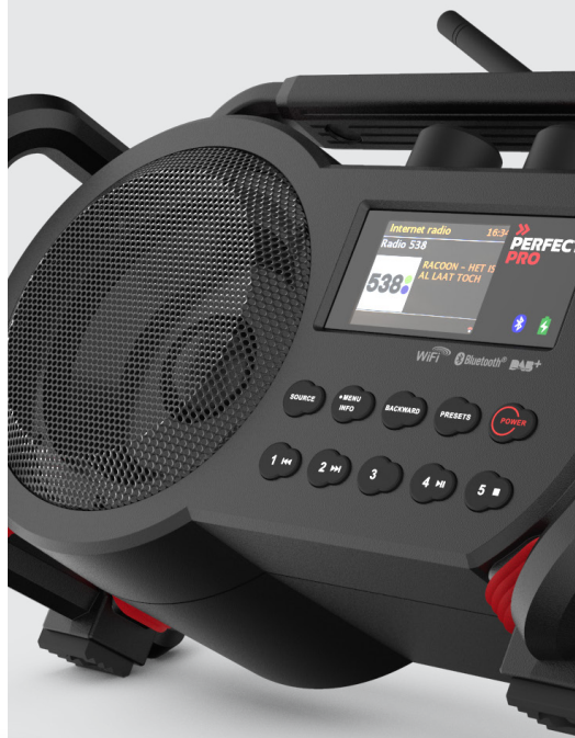
OVERSIZED 5 INCH BIG MAGNET SPEAKER